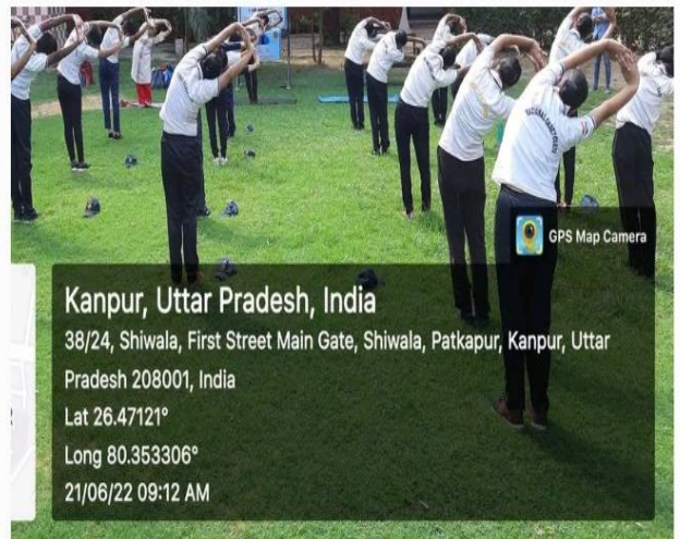
Kanpur, Uttar Pradesh, India 38/24, Shiwala, First Street Main Gate, Shiwala, Patkapur, Kanpur, Uttar Pradesh 208001, India Lat 26.47121° Long 80.353306° 21/06/22 09:12 AM