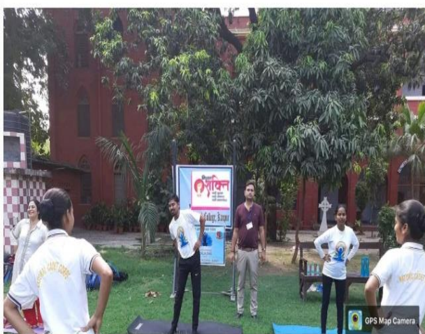
Kanpur, Uttar Pradesh, India 38/24, Shiwala, First Street Main Gate, Shiwala, Patkapur, Kanpur, Uttar Pradesh 208001, India Lat 26.47121° Long 80.353306° 21/06/22 09:12 AM