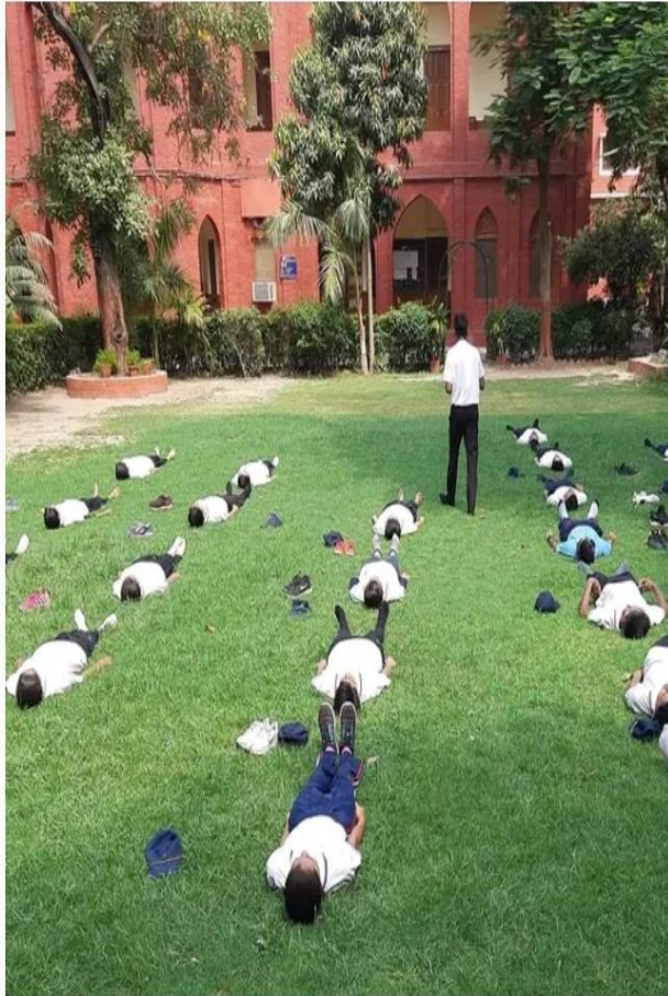
Kanpur, Uttar Pradesh, India 38/24, Shiwala, First Street Main Gate, Shiwala, Uttar Pradesh 208001, India Lat 26.471228° Long 80.353354° 21/06/22 09:20 AM